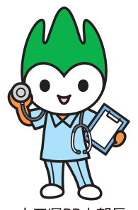
山口県PR本部長 ちよるる